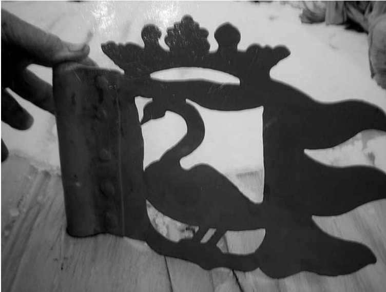
De gerepareerde windvaan

En die heb ik, want intertijd was er al eens eerder een vaan van het dak gewaaid en had mijn tweelingbroer er een tekening van gemaakt. Daarvan heeft hij er zelf toen een reproductie gemaakt, die nog steeds op het prieeltje prijkt bij de boerderij van mijn schoonzuster op de hoek aan de Buorren en de Wergeasterdyk in Goutum.