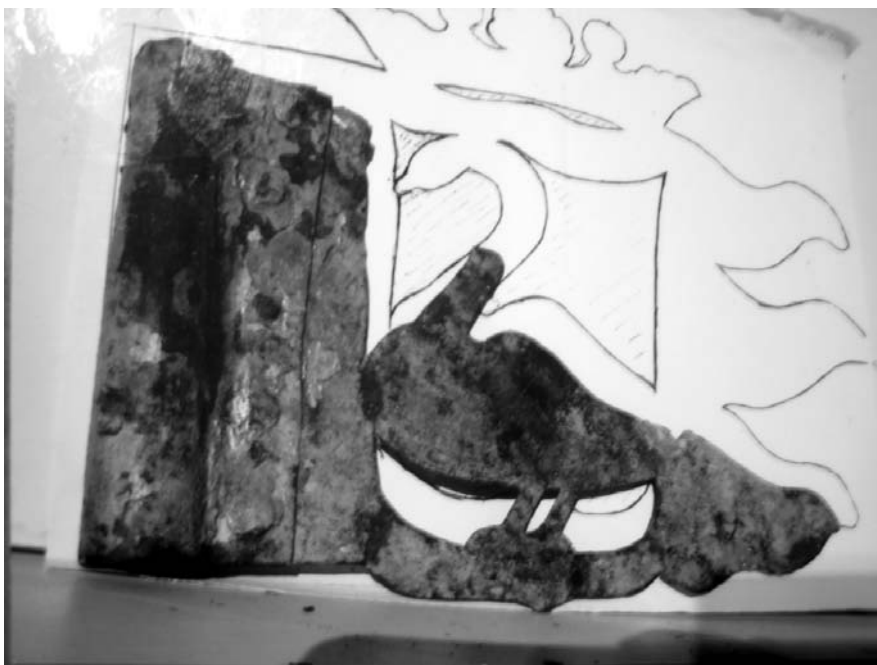
De beschadigde weerhaan met tekening

De foto's laten duidelijk de goudverf zien, maar ook hoe ernstig de windvaan is beschadigd. De intertijd door mijn broer gemaakte tekening hebben we er achter geplaatst en maakt duidelijk hoeveel er ontbreekt. Gelukkig is hij weer geheel gerestaureerd en zal binnenkort weer op zijn hoge standplaats worden gezet.