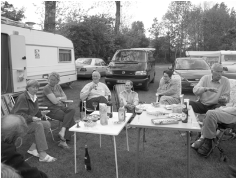
Tijd voor een gezellig praatje / Zeit für einen gemütlichen Plausch

Samenvattend was het een zeer geslaagde familiebijeenkomst met ruim 80 familieleden over twee dagen. Ze kwamen uit Duitsland (39), Australië (2), Verenigde Staten (3), Nieuw Zeeland (1), Engeland (4) en Nederland (34).