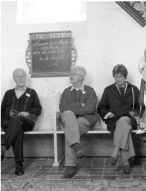
In de kerk / In der Kirche

Freitagabend kamen schon viele Familienmitglieder zur IJsherberg, um sich zu begrüßen oder sich kennenzulernen. Das Restaurant war voll, und es mußte länger gearbeitet werden. Samstag war von 10 bis 11 Uhr Empfang