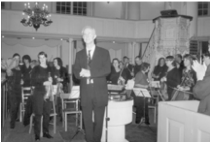
Het orkest / Das Orchester