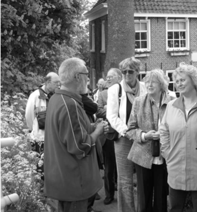
Rondleiding Dokkum door gids / Stadwanderung Dokkum met Führung

darauf zu besichtigen. Die deutsche Gruppe machte erst eine Stadtwanderung mit einem Führer des VVV durch Dokkum. Nach dieser Rundführung / diesem Besuch wurden die Ausflüge gewechselt.