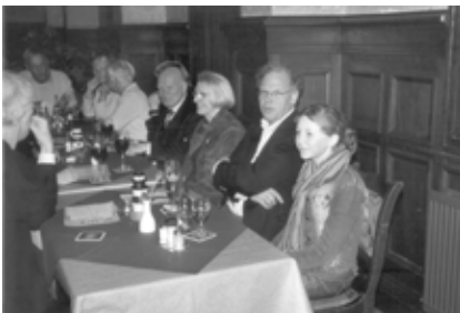
In de / Im Ratskeller