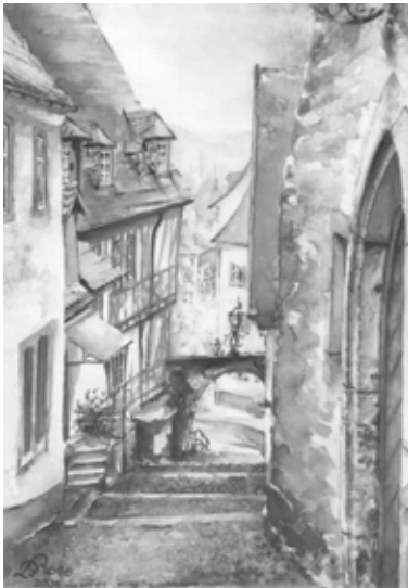
Die Treppe vom Marktplatz zum Haus Conrady (rechts). Das ist die Schloßgasse.