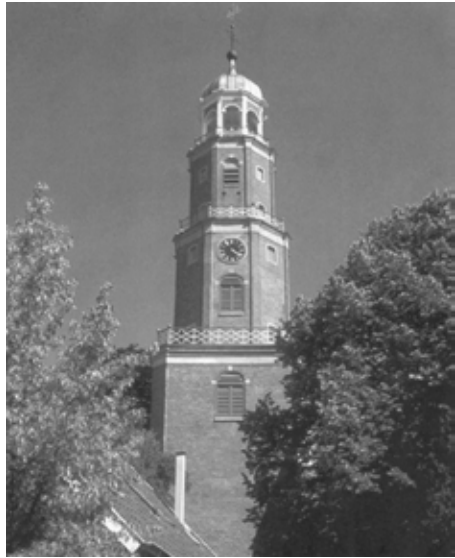
Grote kerk / Große Kirche Leer