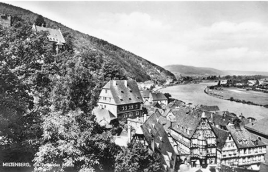
In der Mitte: Das Große Haus Conrady

werden. Das Haus Conrady selbst, ein schönes mehrstöckiges, altes Fachwerkgebäude, von dem aus man einen weiten Blick über Stadt, Main und Landschaft hat, befindet sich auf halber Höhe der Schloßgasse. Wie der Name, Schloßgasse, schon sagt, führt eine steile Stiege, teilweise mit Stufen versehen, vom Marktplatz Miltenberg am Main direkt bis zum Schloß. Die Stadt Miltenberg liegt an dem südlichsten Zipfel des Mains zwischen dem Spessart und dem Odenwald. Nicht nur die Altstadt von Miltenberg mit ihren zahlreichen Fachwerkhäusern, sondern auch die Umgebung der Stadt mit ihren schön angelegten und gepflegten Weinbergen laden zu einem angenehmen Besuch ein.